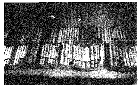
4本で占拠された座席

現在も郡内で移動図書館を行っているのは本町だけです。これは住民サービスの為、地域のみならずのコミュニケーションの場でもあります。 しかし、問題がないわけでは無いのです。その一つは利用者があまり多くないという事です。多くないから、ひとりの方に多くを貸し出せるということもありませんが、やはりみなさんの税金で購入している本、多くの人に読んでもらいたいです。利用状況については表一を見て下さい。 もう一つは、図書費です。表二を見ればわかりますが、本町は、残念ながら、あまり自慢できる数字ではありません。本年度の図書予算は三十万円です。 この理由として、県立図書館が