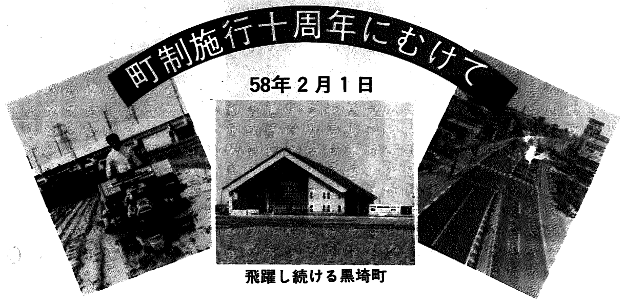
飛躍し続ける黒埼町