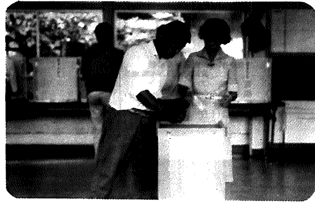
衆参両院同時選挙の投票風景 (興野保育所)