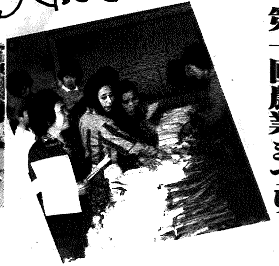
▶野菜品評即売も売れ行き上々

本町では初めての農業祭が十一月八・九日の両日、総合体育館で行われ、前夜祭(八日)の社交ダンス・民謡・翌日(九日)の野菜の品評即売、本年度農作物共進会表彰式、プロ歌手による歌謡ショー、カラオケ大会・新婚さんの激励会、コシヒカリ十キロが当たる抽選会など盛りだくさんの行事に会場は一千人を超える観衆が詰めかけ、終日にぎわっていました。 この農業祭は、生産者と消費者が一堂に会し、相互理解を深め、農産物の生産と消費の拡大を目ざそうと、町と農協が主催して行ったもので、当日は朝市なども開かれ、生鮮野菜類の安売りに消費者が集まり、わずか十五分で売り切れという盛況ぶり。 消費者の一人は「毎年こういう催しをしてもうれつとありがてろも」と、大きな風呂敷づつみを肩に、家路へと急いでいきました。