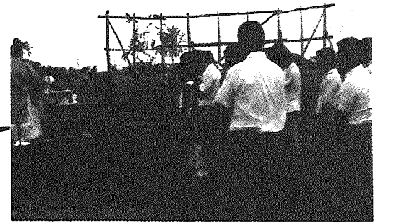
▲神事により安全を祈願する関係者。

小平方自治会では手造りの「ミニ野球場」を建設。六月二十九日子供たちや関係者が集まり、喜びの竣工式を行いました。 このミニ野球場は、S棟所有の雑種地三千平方メートルを借用し、同自治会野球部「とうちゃんクラブ」が主体となり、子供会役員などが総出で整地し、バックネットや回りのフェンスもすべて手造りで建設した。場所は部落の中心地。ライスセンター西側に、両翼約五十メートルと、大人が野球を行うにはちよつと狭い感じはしますが、子供たちにとっては手ごろというところ。 同自治会では「今まで危険な道路でキャッチボールなどを行っていたが、これの完成で、危険も解消され安心して伸び伸び遊べ、心して子供たちの健全な育成もはかれる」と喜びを語っていました。 さらに今後は野球に限らず、ソフトボールやバレーボールなど多目的な利用も考え、子供から老人までが楽しめる全部落民のスポーツ施設としていく方針だそうです。