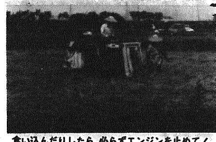
食い込んだりしたら、必ずエンジンをとめて!!