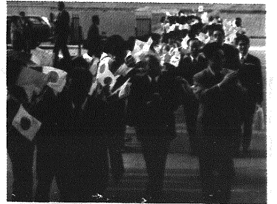
小旗の波に迎えらるる金書記官ら(右から2人目)

折念する「とお礼のあいさつをのべ、各来賓の祝辞、表彰式に次いで、中国側へ大輪の菊の苗を贈り式を終りました。 この後、レセプションに移り、町の郷土芸能保存会による、「神楽舞い」「棒踊り」などをめずらずらそうに見つめ、拍手をおくっていました。 町及び関係者では、これを第一のステップとして、中国の市あるいは町と姉妹都市の関係結び、菊作りはもとより、農業技術の指導、交流をはかり、日・中友好親善をさらに押し進めようとするものです。