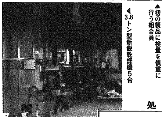
▲初の製品に検査を慎重に行う組合員