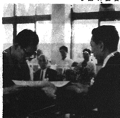
完納の表彰を受ける。中学通り(左)

また、この日、自治会長、納税組合長の永年勤続者表彰が同時に行われ、次の方に町長から、感謝状と記念品が贈られました。(敬称略)