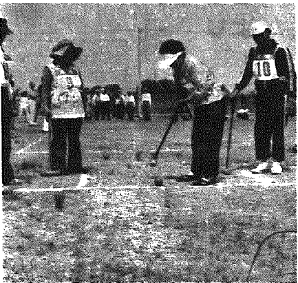
慎重にノねらいをすましてノ

古くは、昭和三十 四年仙台市で開 かれた全国大会で 見事優勝したこと のある、伝統ある スポーツ「ゲート ボール」の取材に NHKが訪れ、五 月二十五日、町営 野球場で寿学級生 三十人が集まって 親善試合を行いました。