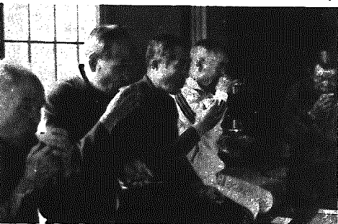
正座して、煎茶の味をたしなむ学級生

この反則金が警察官の給料や 警察の建物の新築費・警察車両 の整備などのために使われている のではないかとという疑問もある ようですが、そのようなこと は一切ありません。 また、「特交金」の交付額は、 人口密度や事故発生件数などに より決められ、都道府県や市町 村ごとの取り締まり件数には全 く関係ありません。 私たちの町へは、昨年度四百 五十三万八千円が交付されてい ます。