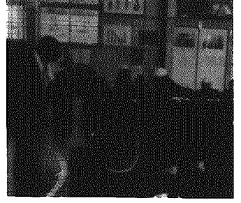
親子いっしょの楽しいレク。一こま一こまが話さなくとも通ずる親子の対話であり教育でもあり、有意義な一日を過ごしていたようです。(原稿・写真とも板井小より)