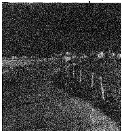
現在、寒風について工事が進められています。すでに新潟市側は完成しており、新潟・亀田・内野線

緒立の狭い道路(県道新濁・燕線)の西側にもう一本、道路を建設し交通の緩和をはかる「緒立バイパス」工事が始まっています。同線は、本町と新潟市寺尾を結ぶ主要地方道で、年毎に交通量が増加するにもかかわらず、道路幅は三・六メートルと狭く、車のすれちがいも非常に困難な上、曲折が多く、児童・生徒の登下校には常に危険がつきまとい、地元住民から「なんとかしてほしい」と要望されていた。 ようやく県では、現在の道路西側に、約七九〇メートル、巾十メートル(車道六メートル)の二メートルの歩道を設ける、バイパスの建設に着手、交通の緩和をはかり、事故の解消につとめることになり、