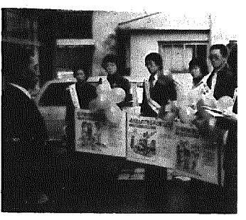
豊かな地域社会の建設を図ってほしいと啓蒙に訪れているもので

十一月十五日、青少年の健全な育成を図り、明るい新潟県の建設に寄与してほしいと、県内の市町村を訪問しているキャラバン隊の一行が本町を訪れ、知事からのメッセージを町長に手渡しました。 町長はこれに答え「力を合せて次代をにやう青少年の育成に努めます」と宣言を行いました。 このキャラバン隊は、新潟県が新潟地区と長岡地区で二班を編成県内の各市町村を廻り、青少年の非行防止を重点テーマに、明るい