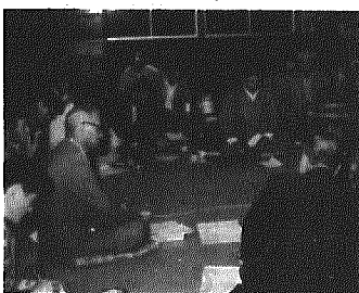
木場部落での座談会

地元人権擁護委員は、Bらに対し、信教の自由は何人も侵すことのできない基本的人権であることを説示するとともに、Aが老人ホームに入園を告げたところ、Bらは自らの非を認め、信仰の強制はしないとの約束するとともに、Aが望むのであれば、Aを老人ホームに入園させると快く了承した。後日、Bらから、Aの希望どおり老人ホームに入園させた旨連絡があった。