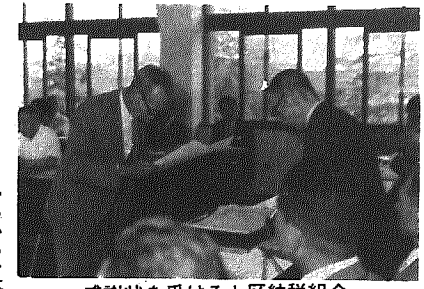
感謝状を受ける七区納税組合

納税成績は昭和四十六年度からわずかながら上昇のカーブをとり、本年度の収納額は二億七千九百八十七万八千二百五〇円に昇り、前年度収納率九八・八二％に比し、一・六％アップした。完納組合は四四組合中、一八組合と昨年より一組合の減にとどまった。