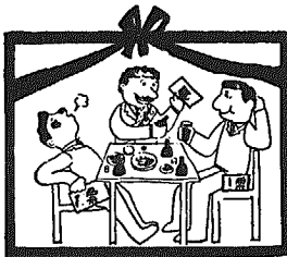
こんな選挙は葬りましょう

◎よく棄権も一つの批判であるという人があります。政治に対する批判にはいろいろな形があるので、しかしに棄権も一つの態度