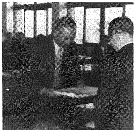
分十二時と一時二時三時まで 持参するもの 新規申請の人