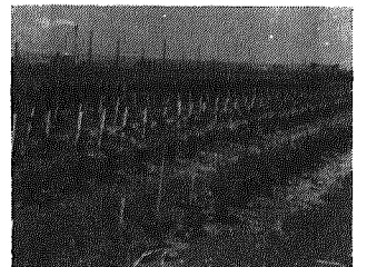
田んぼでナスの栽培

本年度稲作転換の推進は、昨年の転作実績と地域の実情をとりいれて行方方針で配分され、さる五月二十日まで農家から提出された実施計画にもつき、七月一日を基準に農家組合長、損害補償員の協力を得て現地確認を実施しました。 その結果、稲転面積では昨年一昨年の面積を上回る四七、七ヘクタール、実施数量二五二、四トンとなり、目標配分数量二五四トンに対し九九・四%の達成率となる。種類別内訳は普通転作二五・五ヘクタール、集団転作二一・六ヘクタール、魚介類養殖水田〇・四ヘクタール、永年性植物〇・二ヘクタールで作物別では野菜がトツなかでも枝豆、里いもだけで三五%を占め、次いで球根類となっている。このように稲転面積が過去四年間五〇ヘクタール前後を推移