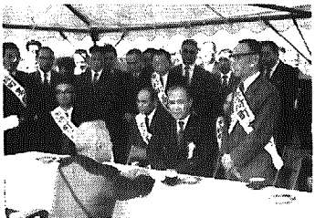
十月一日、町営グラウンド(県立高校建設予定地)において、広域営農団地農道整備事業の着工式に出発の巨農知事が来町された。