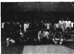
昨年のリーダー研修に参加の職員

交通調停は、全国五七五ヶ所にある簡易裁判所で行われています。交通調停を利用するには、この簡易裁判所の窓口で調停の申立てをすればよいのですが、この申立ては、原則として相手方が住んでいるところにある簡易裁判所に行かなければなりません。もっとも、申立人が交通事故で傷を負っている場合は経済的に苦しく、遠方の裁判所に行けないなどの特別な事情があるときは、自分の住所のところが簡易裁判所でも取り扱って相手が申立をしてくることをお勧めします。