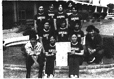
賞状を手に喜びの各選手

試合は参加四チーム総あたり戦で行われ、好プレー珍プレー続出のうちに黒埼町婦人バレーボールチームがみごとなチームプレーで全勝優勝を果した。