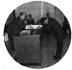
表彰を受ける入賞者

揺れ動く農政のなかで農業生産の向上をめざすということは経済的、社会的に於いても非常に困難なことである。本村では伝統ある農作物共進会を農産物の需要の動向に即応させながら実施方法の改善を関係団体の意見を聞きながら実施して参ります。 特に米の需要変化に伴ない米以外の農畜産物の需要増大の見とおしから、花卉、園芸、畜産部門の生産増加が漸次あらわれていくことから、これらの共進会出品参加を呼びかけ生産意欲の昂揚に努めてまいりました。 去る十一月二十一日黒埼農協において四十七年度農作物共進会表彰式が行なわれ「良質米」「園芸」