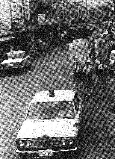
村内交通事故発生状況