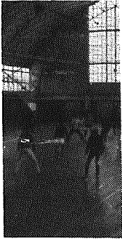
熱戦を繰りひろげる第6回大会

五月晴れに恵まれた、五月二十八日(日)大野小学校体育館において、第六回村民バレーボール大会が開催され、熱戦に付き熱戦、好試合が展開され、前回の優勝チーム、ココロ支社を2-0のストレートで下し通算