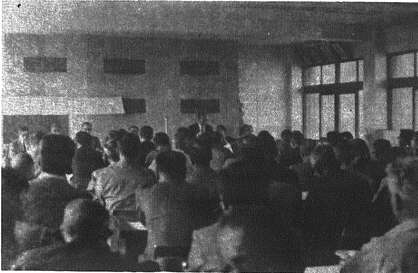
上越新幹線のルート説明会 役場講堂