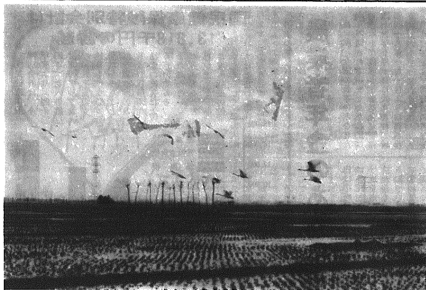
何を間違えたのか、本村木場部落の田んぼに白鳥が飛来 (1/22)