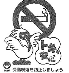
受動喫煙を防止しましょう