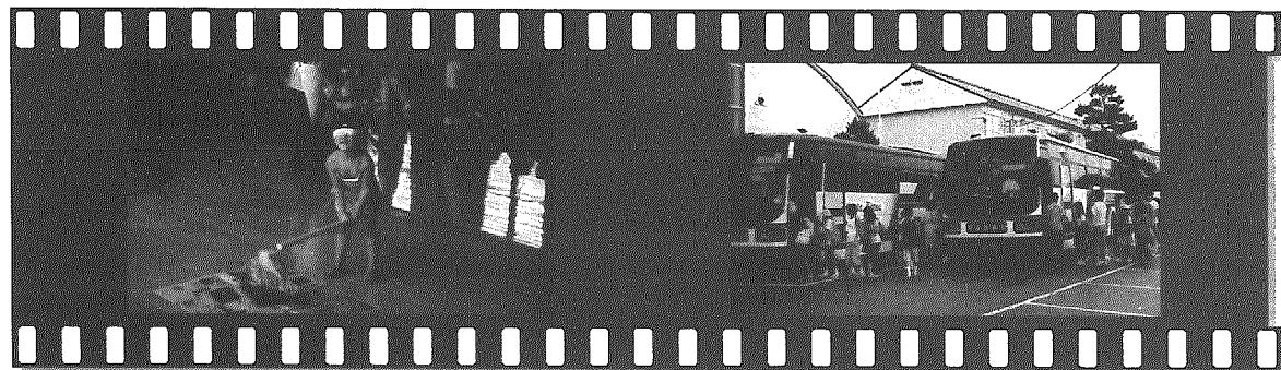
スイカ割り「右・右!」「左・左!」みんなの声援を受けて「ハカーン」と上手に割れました。