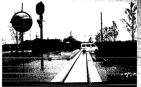
旧月湯駅周辺整備(月湯地区)