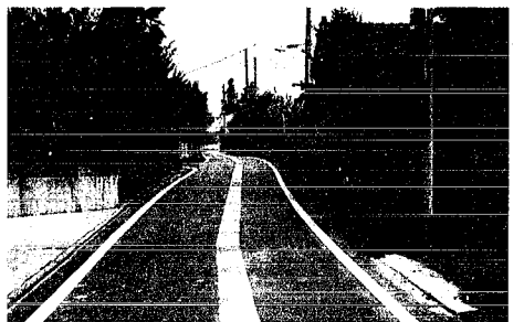
消雪パイプ布設(上曲通地区)