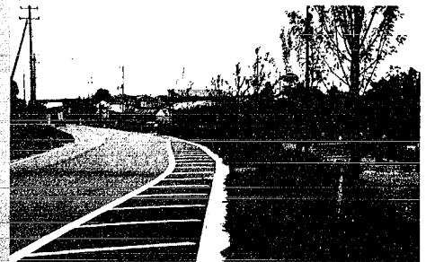
遊歩道の設置(下曲通地区)