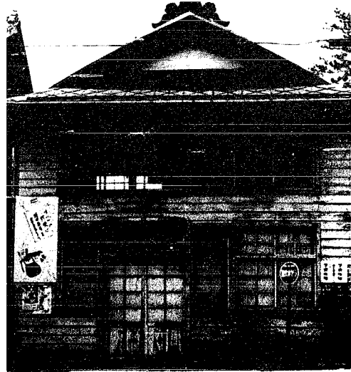
月瀧3番町にあった旧郵便局舎を撮ったものです。