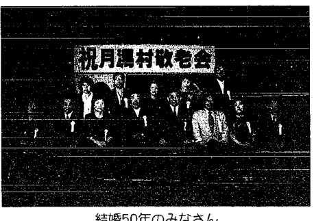
結婚50年のみなさん