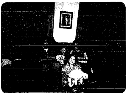
▲ホストファミリーとペットの犬

僕は、国際交流について全く考えたことがありませんでしたが、今回海外研修でオーストラリアに行くことを希望しました。 僕は、オーストラリアに10日間滞在し、現地の人と国際