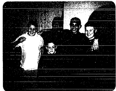
▲ホストファミリーの3人兄弟とその友達

あります。それは、話の通じない所で、回りが外国人ばかりで、その中に日本人が一人いると、一体どんなふうに見えるか、思われているかなど、考えてしまうことがあります。でも、一言、あいさつをされると、その気持ちもなくなります。それに、学校に行つたときは、いろんな生徒に声をかけられて、不安もなくなり、とてもうれしかったです。 僕は、この海外研修を通して、あいさつはとても大切なこと。そして、どんな時でも、あいさつは、必要だと思えました。本当に、このような海外研修ができてよかったです。