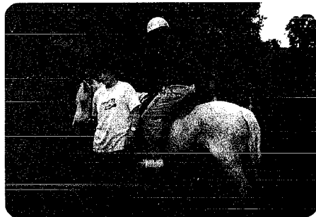
▲ホストファミリーの馬に乗せてもらったところ。

だから、もっとたくさんの人に僕達と同じ体験をしてほしいです。そして宇宙一の宝物を一秒でも早く見つけ出してほしいです。そうすれば今以上に良い国いや、いい地球になる気がします。絶対に！