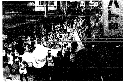
昭和39年、村内で行われた国体旗リレーを撮ったものです。