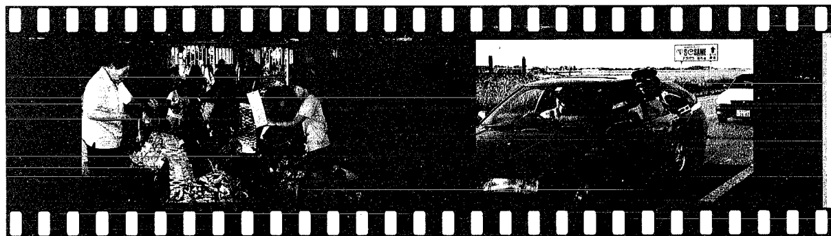
祖父母学級の後、おばあちゃんたちと七夕飾りを行い短冊にはいろいろな願い言が……。