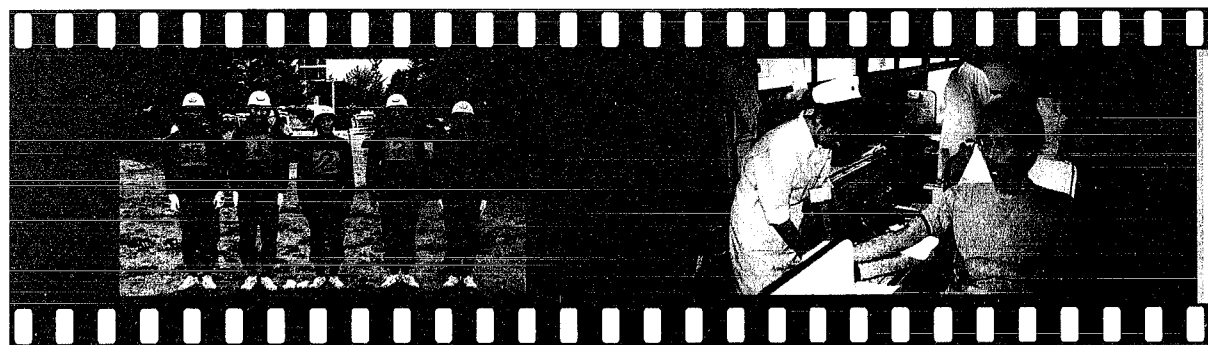
郡操法大会に出場された選手の方皆さんです。連日連夜の訓練ご苦労様でした。