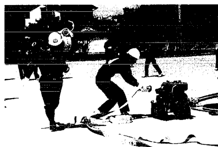
村の小型ポンプ操法競技大会

なお、第1分団第1部は月湯村の代表として、7月7日中之口村で開催された郡小型ポンプ操法競技大会に出場しました。