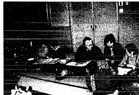
暖かい気候になって来ましたが、家にばかり閉じ込められず、保健福祉センターで月2回ちぎり絵、組みひもの手工芸訓練を行ってみませんか。送迎用バスを運行しておりますので、仲間作りの為に参加ください。

今までは対象から除かれていた夜間部、定時制課程及び通信制課程の学生さんも、前年所得が68万円以下の場合、承認されることになりました。