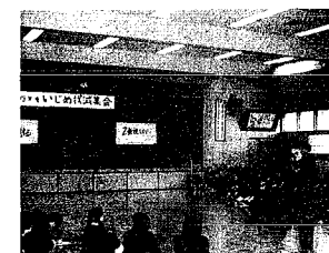
㉞ 食堂棟冷暖房設備工事が行われます