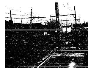
㉞ 集落緑化施設整備(旧月潟駅)