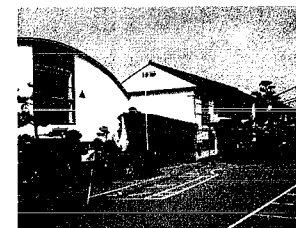
㉞ 小学校新築のため基金を積立します