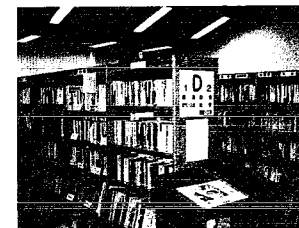
㉞ 図書が増冊されます