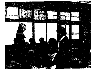
㉞ ALTハザー先生の授業風景