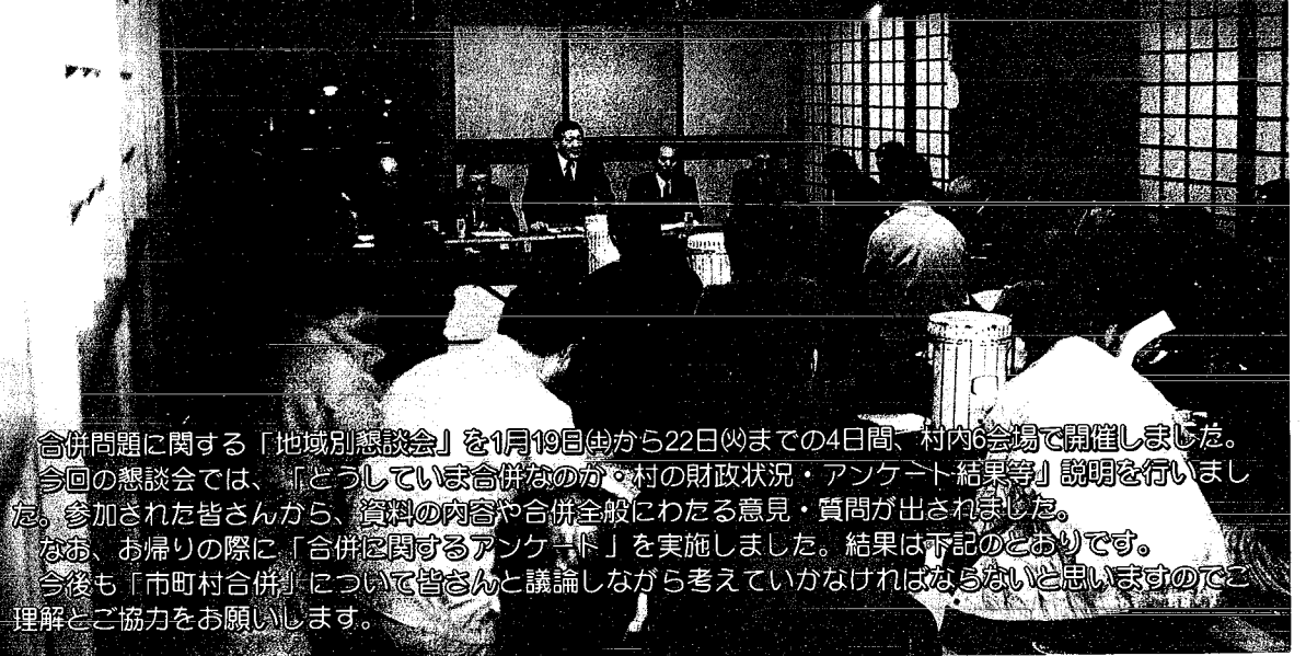
合併問題に関する「地域別懇談会」を1月19日(金)から22日(月)までの4日間、村内6会場で開催しました。今回の懇談会では、「どうして合併なのか、村の財政状況・アンケート結果等」説明を行いました。参加された皆さんから、資料の内容や合併全般にわたる意見・質問が出されました。なお、お帰りの際に「合併に関するアンケート」を実施しました。結果は下記のとおりです。今後も「市町村合併」について皆さんと議論しながら考えていかなければならないと思いますのでご理解とご協力をお願いします。