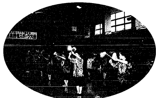
レクダンスサークルの皆さんが高齢者スポーツ大会で踊りを披露しました。若者には負けず元気です。