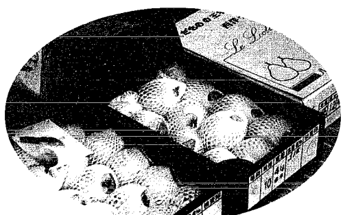
くだものの貴婦人ルレクチェの出荷が始まりました。早く食べてみたいですね!!