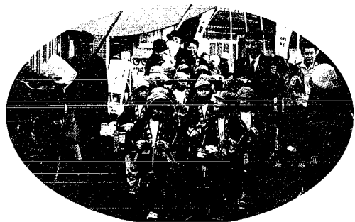
幼年消防クラブの皆さんが市日にあわせて「火の用心」を呼びかけました。火災予防に努めましょう!!