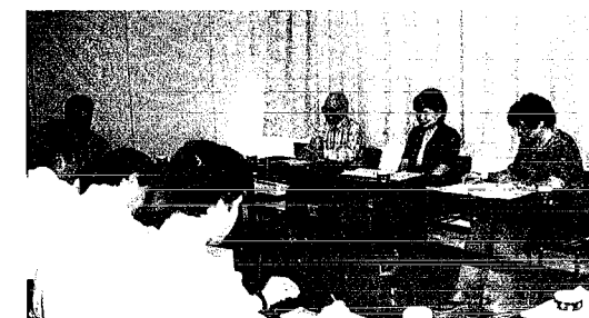
国民健康保険運営協議会で審議されました

毎年、「私は社会保険加入なのにどうして国保税がくるの？」という問合せがありますが、国保税の納税義務者は世帯主になるため世帯主が国保に加入していなくても、世帯員が加入していれば世帯主に課税することになります。