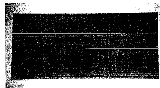
現在の国民健康保険被保険者証