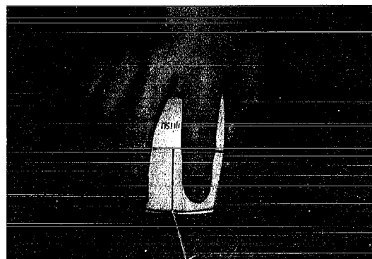
▲マウスを使ってダブルクリック。