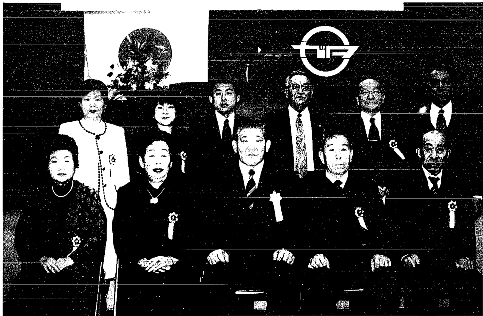
平成12年度の村政功労者の表彰式が1月14日農村環境改善センターで行われました。村政の発展、産業文化、福祉の向上等に尽くされた功績を称えて12人の方が表彰されました。

○村の行政、教育文化、産業、保健衛生、民生、土木、土地改良、災害、納税、慈善事業、その他公益事業について功労顕著なる者