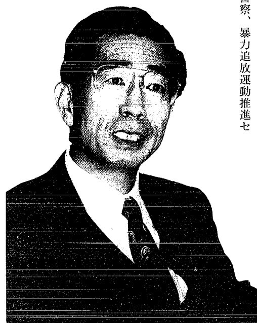
(やまおか・まさあき) 1946年群馬県生まれ。74年弁護士登録。97年群馬弁護士会会長。99年6月より日本弁護士連合会・民事介入暴力対策委員会の委員長を務める。