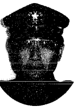
長 繁 樹 団 島 間 (教育主幹兼務)