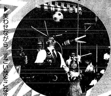
「笑わせながら、すごい技をこなす」

商工会主催による「大道芸フェスティバル」が月潟商店街メインストリートを会場に午前11時から午後5時まで行われ、一流の大道芸人9組がジャグリング、アクロバットなど様々なストリートパフォーマンスを繰り広げました。その他にフリーマーケット、大道芸教室、ぬり絵展示会、お米が当たる犬猫選会など子供から大人まで楽しめる企画が盛りだくさんでした。