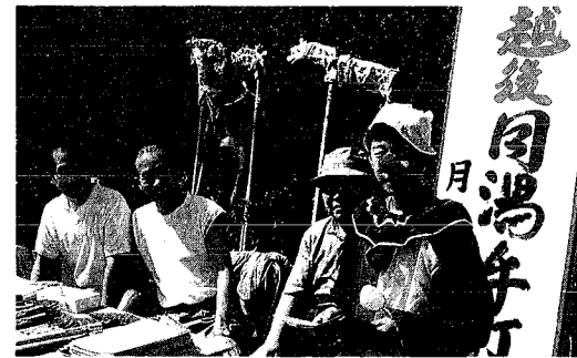
「大人気だった子ビエロ君」