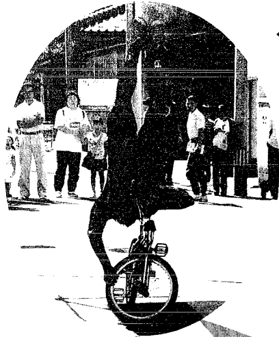
「自転車は正しく乗りまじょう」