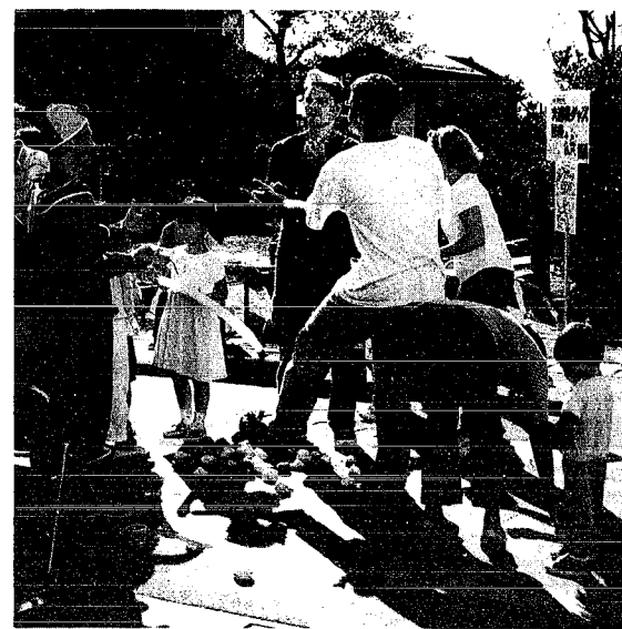
▲ジャグリング教室

秋晴れの好天に恵まれた9月23日、「秋分の日」は獅子の里で楽しむ「月潟」をキャッチコピーに月潟村で幾つかのイベントが開かれました。 月潟村農村環境改善センターでは、第18回観光キャンペーン「角兵衛獅子の舞」が行われ、会場では村の特産品が販売されたり、村の郷土芸能の「角兵衛獅子」「月潟太鼓」が披露され、一、〇〇〇人を越す観客で賑わいを見せました。 また、旧新潟交通電鉄の電車車内開放や午後3時30分から同会場にて角兵衛獅子撮影会なども行われました。キャッチコピーのように、観客のみならずにとつて心に残った秋の日だったのでないでしょうか。