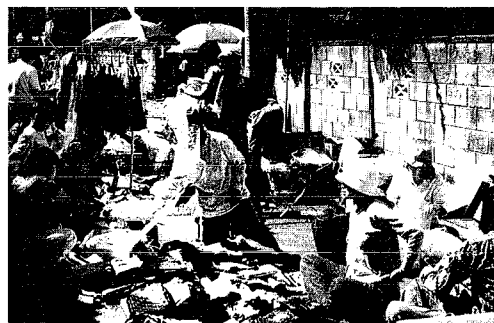
「フリーマーケット 欲しい物が ありましたか?」

秋晴れの好天に恵まれた9月23日、「秋分の日」は獅子の里で楽しむ「月潟」をキャッチコピーに月潟村で幾つかのイベントが開かれました。 月潟村農村環境改善センターでは、第18回観光キャンペーン「角兵衛獅子の舞」が行われ、会場では村の特産品が販売されたり、村の郷土芸能の「角兵衛獅子」「月潟太鼓」が披露され、一、〇〇〇人を越す観客で賑わいを見せました。 また、旧新潟交通電鉄の電車車内開放や午後3時30分から同会場にて角兵衛獅子撮影会なども行われました。キャッチコピーのように、観客のみならずにとつて心に残った秋の日だったのでないでしょうか。