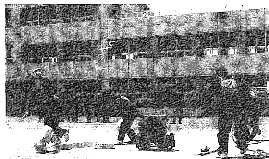
▲小型ポンプ操法 ソレ