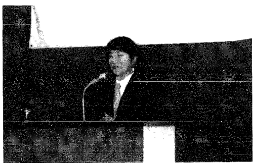
楽しく聞き入っていられた大山節に酔っていられたようです。