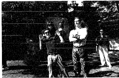
▲ユニバーサルスタジオの俳優さんと楽しい1日

このような事は、例えば、ハイウェイを例にとつても、3人以上乗車している車輛や乗合バス等には専用レーンが当てられるなど規制の強化のみにとどまらず、前向きな優