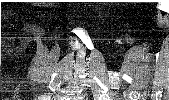
会場は多くの観客であふれていました。特産品もあつという間に完売。

毎年、秋分の日に開催される観光キャンペーンも、今年で16回目となりました。お目当てはもちろん「角兵衛獅子の舞」。ご存じのとおり、角兵衛獅子は昔から伝わる郷土芸能として全国的に知られ、上演されるのは6月の月潟まつりとこの観光キャンペーンの2回とあって、当日は雨天にもかかわらず県内外から700人以上の観客を集めました。 頭に獅子頭、胸に卍のもんぺ姿の子どもたちが登場し、妙技の数々を披露すると、会場からは割れんばかりの拍手が湧きおこりました。 また、勇壮なバチさばきと切れ味のよい月潟太鼓も会場を賑わせてくれました。 このキャンペーンは「秋分の日には獅子の里で楽しもう」をキャッチフレーズに、月潟村の観光と物産を紹介し、地域の活性化を図ることを目的として行われており、会場には村の特産品も販売され、大盛況のうち幕を閉じる事ができました。キャッチフレーズのように、観客のみならずにとつて心に残った秋の日だったのではないのでしょうか。