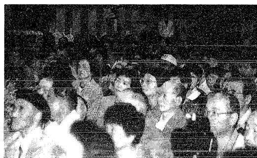
会場は多くの観客であふれていました。