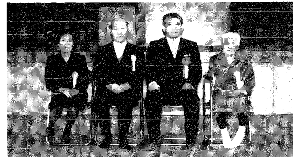
▲90歳をむかえられたみなさん