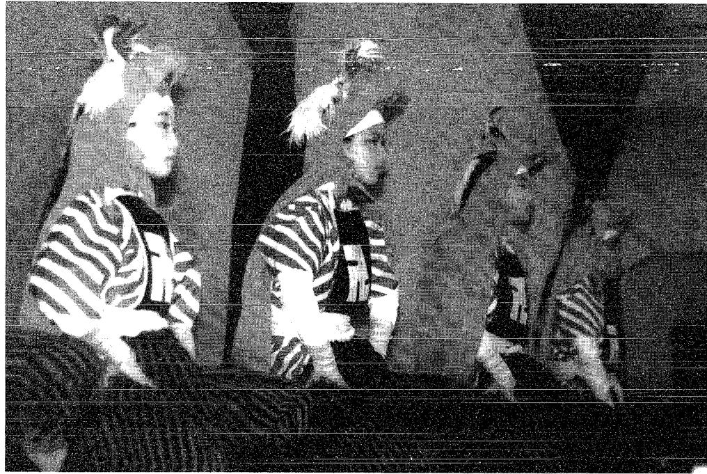
獅子頭にもんぺ姿の子どもたち

毎年、秋分の日に開催される観光キャンペーンも、今年で16回目となりました。お目当てはもちろん「角兵衛獅子の舞」。ご存じのとおり、角兵衛獅子は昔から伝わる郷土芸能として全国的に知られ、上演されるのは6月の月潟まつりとこの観光キャンペーンの2回とあって、当日は雨天にもかかわらず県内外から700人以上の観客を集めました。 頭に獅子頭、胸に卍のもんぺ姿の子どもたちが登場し、妙技の数々を披露すると、会場からは割れんばかりの拍手が湧きおこりました。 また、勇壮なバチさばきと切れ味のよい月潟太鼓も会場を賑わせてくれました。 このキャンペーンは「秋分の日には獅子の里で楽しもう」をキャッチフレーズに、月潟村の観光と物産を紹介し、地域の活性化を図ることを目的として行われており、会場には村の特産品も販売され、大盛況のうち幕を閉じる事ができました。キャッチフレーズのように、観客のみならずにとつて心に残った秋の日だったのではないのでしょうか。