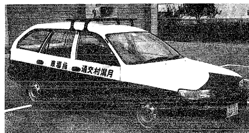
新規に購入された 交通安全指導車