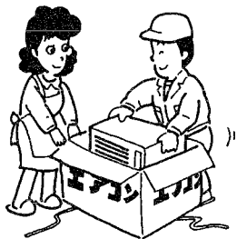
専用のコンセントがありますか