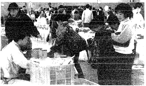
ちよこ町の町長形町