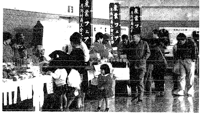
特産品販売コーナー